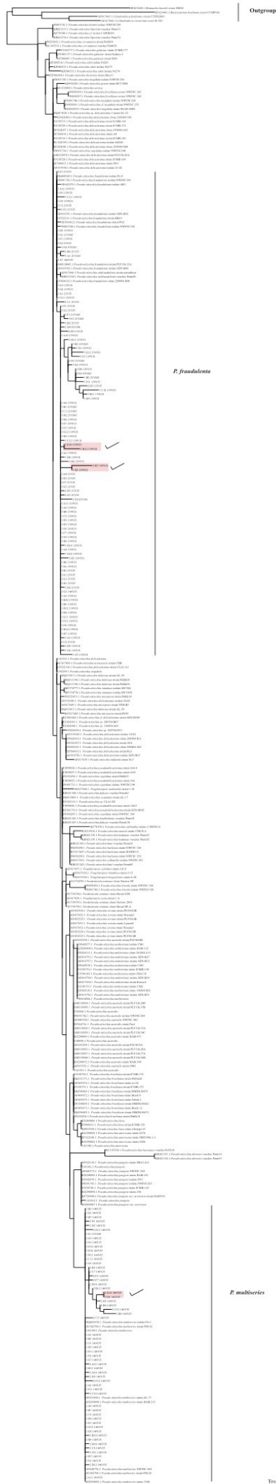
Fig. S1. Maximum likelihood Phylogenetic analysis of CLS from a 430bp alignment of partial LSU fragment derived from D1-186F-D1-548R PCR amplification with- publically available LSU reference set of Pseudo-nitzschia sequences along with other diatom sequences as an outgroup. Pink boxes indicate clades that correspond to Fig. 2A and 2B Check-marks indicates sequences recovered together in Fig, 2A and 2B. Sequence name prefixes have been abbreviated thus: 409239201 2 has been shortened to 2 and 409239202 3 has been shortened to 3.